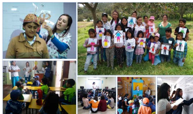
Ilustración 1. Proceso de enseñanza aprendizaje y su formación en valores

Cabe considerar que el ser humano está dotado por una serie de códigos y reglas que debemos cumplir dentro de una sociedad. A continuación, se puede visualizar varias ilustraciones en donde se demuestra el proceso de enseñanza aprendizaje y su formación en valores, en este caso, cómo las estudiantes deben comprender el funcionamiento del Sistema Nervioso Central para que un niño adquiera una adecuada comprensión, y que tengan conocimientos de que sucede cuando presentan dificultades de aprendizaje, porque no capta bien, cual es la causa, una inmadurez en su parte neurológica o la presencia de dificultades en su hogar, y es aquí en donde los docentes tenemos el deber de acercarnos e indagar para ayudar a ese niño, porque es nuestra responsabilidad el sacarlo adelante.