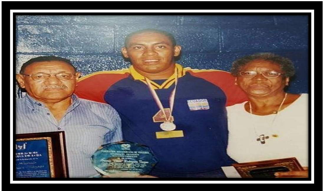
Despedida como mejor voleibolista ecuatoriano.