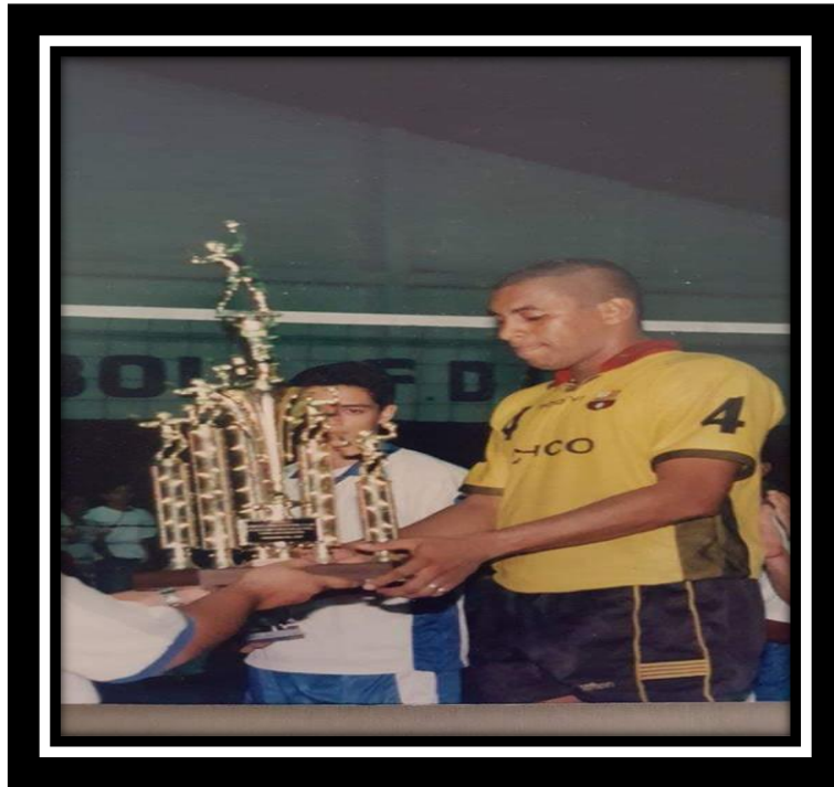
B.S.C. Campeón Nacional, Capitán.