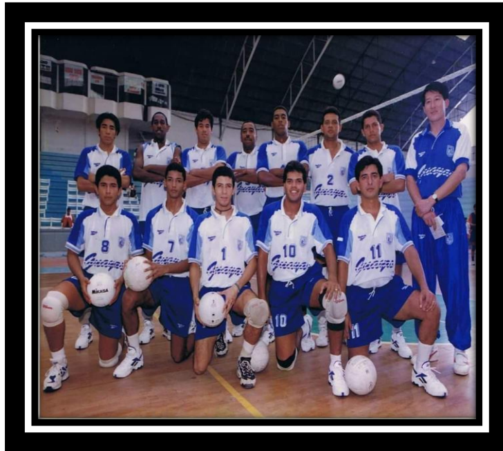
Campeón Nacional selección de Guayas