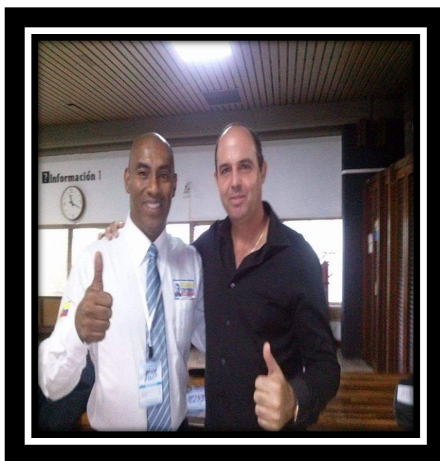
Expositor en congreso AFIDE 2019 Cuba.