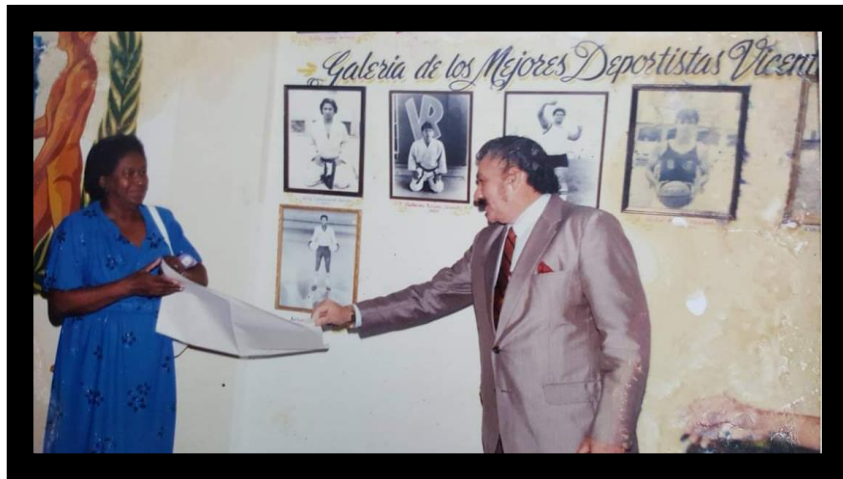
Mejor deportista del Vicente Roca fuerte 198.