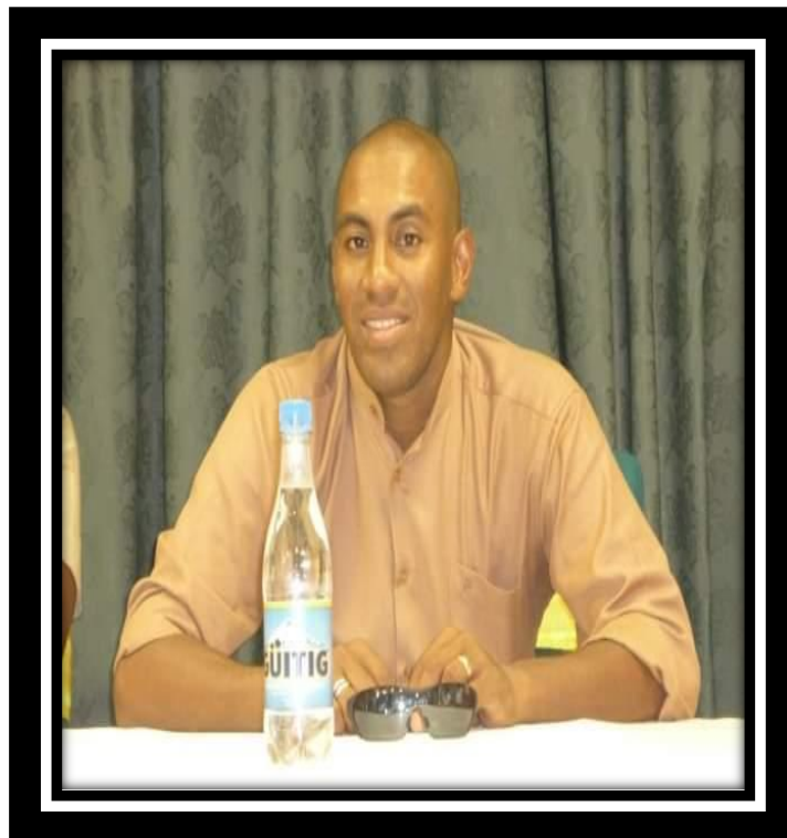
Rueda de prensa.