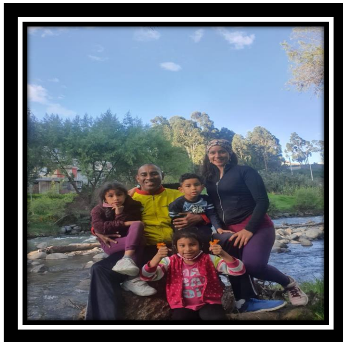
2021- En compañía de la familia.