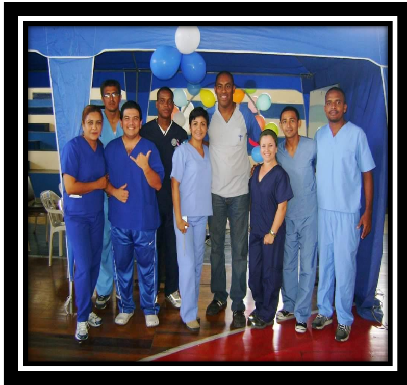
Casa abierta con alumnos.