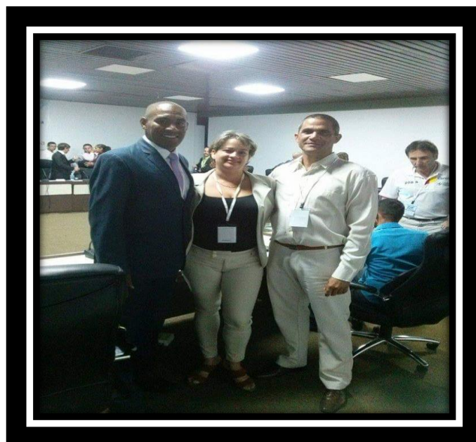
Compañeros Doctorado en Cuba.