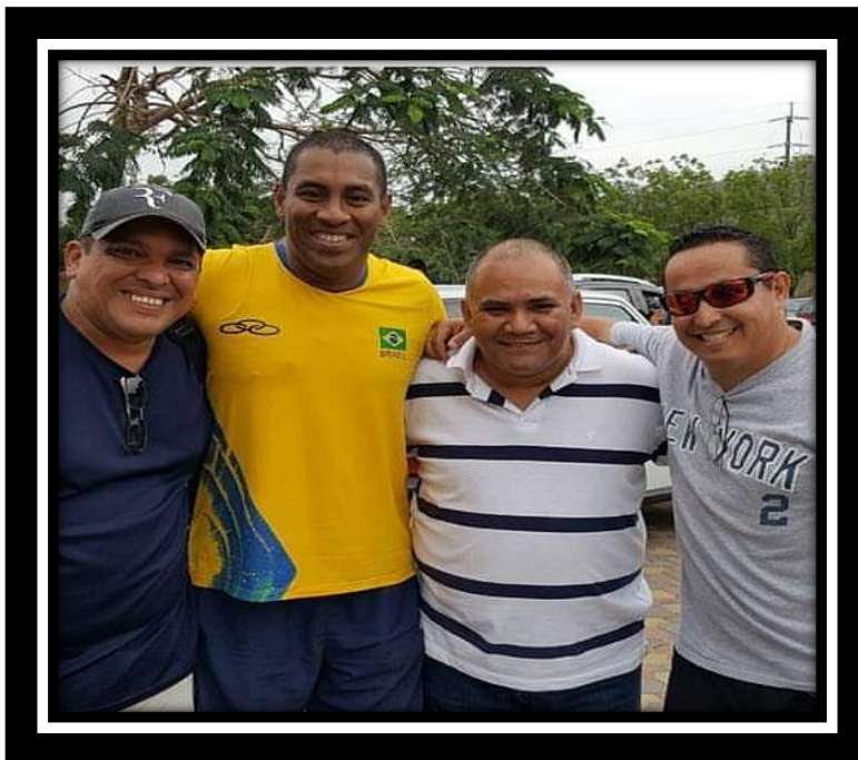
Compañeros y amigos de la infancia